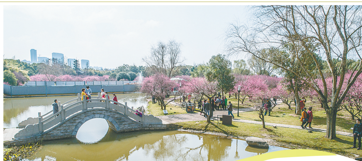
2月28日,游客在长沙市橘子洲景区观赏梅花。近日,湖南省长沙市橘子洲景区的500余株梅花盛开,吸引了大批市民和游客前来观赏。