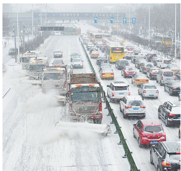
2月28日,在哈尔滨市主干道中山路上,大型清雪机械在清雪。

据了解,除九个区外,哈尔滨市所辖九县(市)可根据当地天气情况,自行决定停课天数和开学时间。