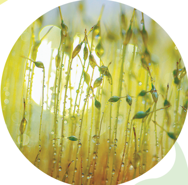
2月28日,在湖北省恩施市芭蕉侗族乡灯笼坝村,樱花在茶园上方盛开(2月28日摄)。

随着天气回暖,湖北省恩施土家族苗族自治州恩施市芭蕉侗族乡的茶园转绿,山中樱花竞相绽放,春意渐浓。