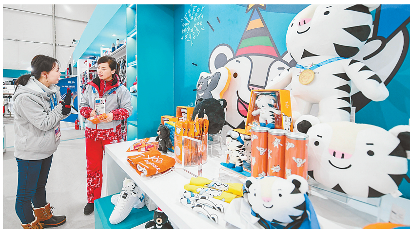
北京冬奥会官方特许商品经营店