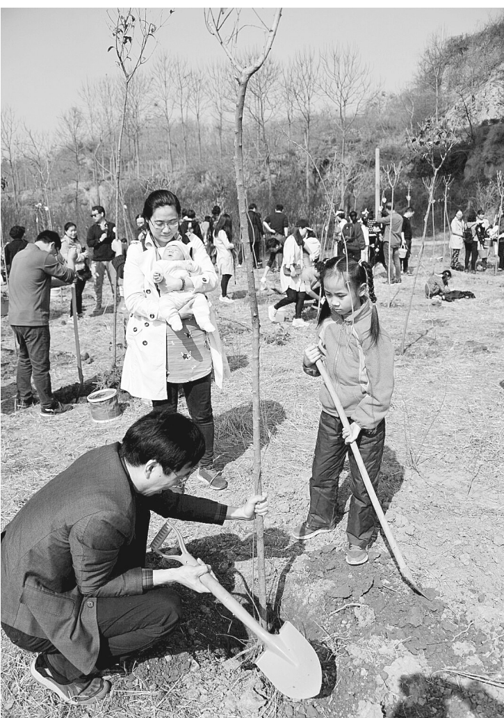
昨日，荥阳市林业局邀请郑州纬一路小学的师生来到索坡村，开展“拥抱春天 与小树共同成长”义务植树活动。学生和家长们首先来到去年亲手种下的小树旁，看看一年过去了，这些小树和孩子们一起长高了多少，然后又来到一片山坡下，种下了200余棵新的小树。本报记者 史治国 摄

消除卫生死角、消除“四害”滋生地、控制“四害”密度、加强病媒生物消杀防制工作为中心，以多种方式展开防制活动，共组织工作人员及专业防制人员800余人，消杀车辆及设备280台，使用药物1300余公斤，完善、修复、新增毒饵洞(灭鼠)2000余个，发放除“四害”、预防传染病为内容的宣传彩页8000余份。