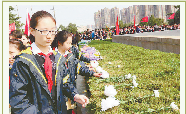
近日,郑州中学附属小学百名少先队员来到郑州烈士陵园开展清明祭扫活动,缅怀先烈寄哀思。

下一步,郑州市纪委将根据《通知》要求,对利用工作时间进行祭扫;使用公车或公款进行私人祭扫、游玩、探亲访友等活动;使用公款旅游或走亲访友、参观旅行期间接受基层单位安排的宴请、住宿等;以祭祀名义大操大办、借机敛财;借祭祀之机用公款互相宴请或组织隐秘聚会;违规参加或组织老乡会、校友会、战友会;用公款为回乡探亲、祭祀的党员干部提供旅游、餐饮住宿等接待;参与各种迷信活动等违规行为进行严肃查处,对节假日期间发生的顶风违纪问题露头就打,发现一起查处一起,点名道姓通报曝光,始终保持高压态势。