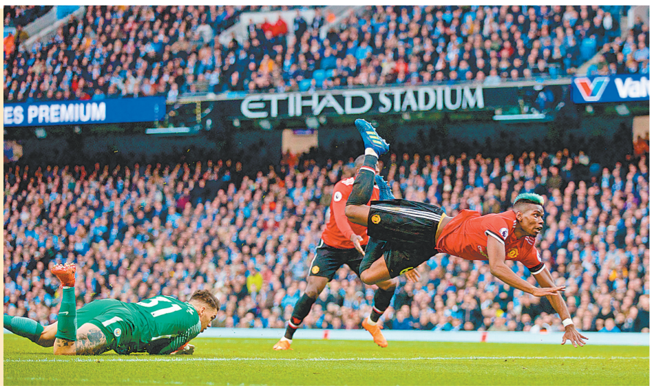
4月7日,曼联队球员博格巴(右)在比赛中攻入一球。当日,在英国曼彻斯特伊蒂哈德体育场进行的2017/2018赛季英格兰足球超级联赛第33轮比赛中,曼联队在上半场先失两球的情况下客场以3:2逆转曼彻斯特城队,阻止了同城对手本轮提前夺冠。