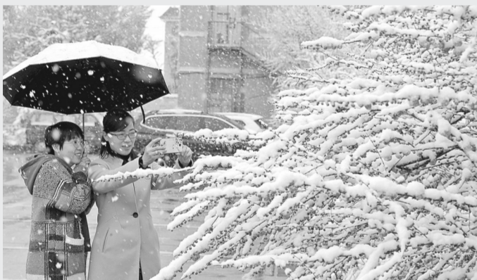
居民雪中拍照

据新华社乌鲁木齐5月7日电(记者 符晓波)新疆北部和东部受寒潮天气影响出现明显降温降水天气，其中乌鲁木齐、哈密市等多地出现雨夹雪、雨转雪，温度最高骤降15摄氏度左右，当地果林业、畜牧业、农业及道路出行受到不同程度影响。