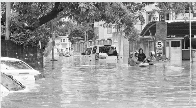
消防官兵转移被困人员

新华社厦门5月7日电(记者 付敏 颜之宏)7日，一场特大暴雨突袭福建厦门。厦门岛内多处路段出现严重积水，道路封闭，厦门机场超过100个航班因暴雨延误。