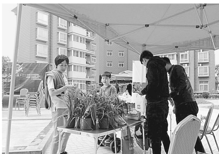
为增强居民环保意识，5月6日，中原区航海西路街道办事处帝湖花园社区开展了旧书换绿植公益活动。

强化阵地建设，促基层保障提升。按照“典型示范、以点带面、整体推进、全面提升”的工作思路，街道强力推进楼宇党群服务中心建设，将位于大同路14号楼7层、建筑面积约400平方米的街道自有办公用房打造成具有德化特色的非公党建示范点，努力开创辖区企业共商区域发展、共抓基层党建、共建先进文化、共同服务群众、共建美好家园的新格局。