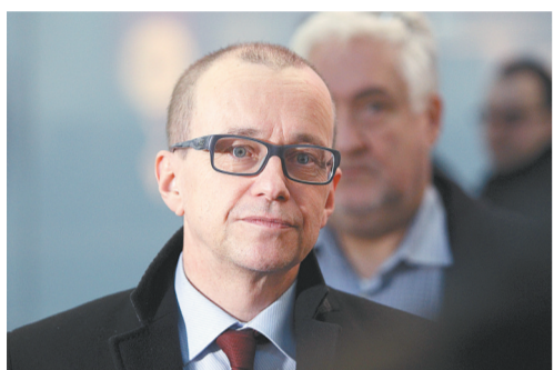
这是2014年2月10日在奥地利维也纳机场拍摄的泰罗·瓦尔约兰塔的资料照片。

国际原子能机构副总干事兼保障监督部门主任泰罗·瓦尔约兰塔11日辞去职务。路透社报道，美国退出伊朗核问题全面协议3天后，瓦尔约兰塔辞职，时间点敏感。