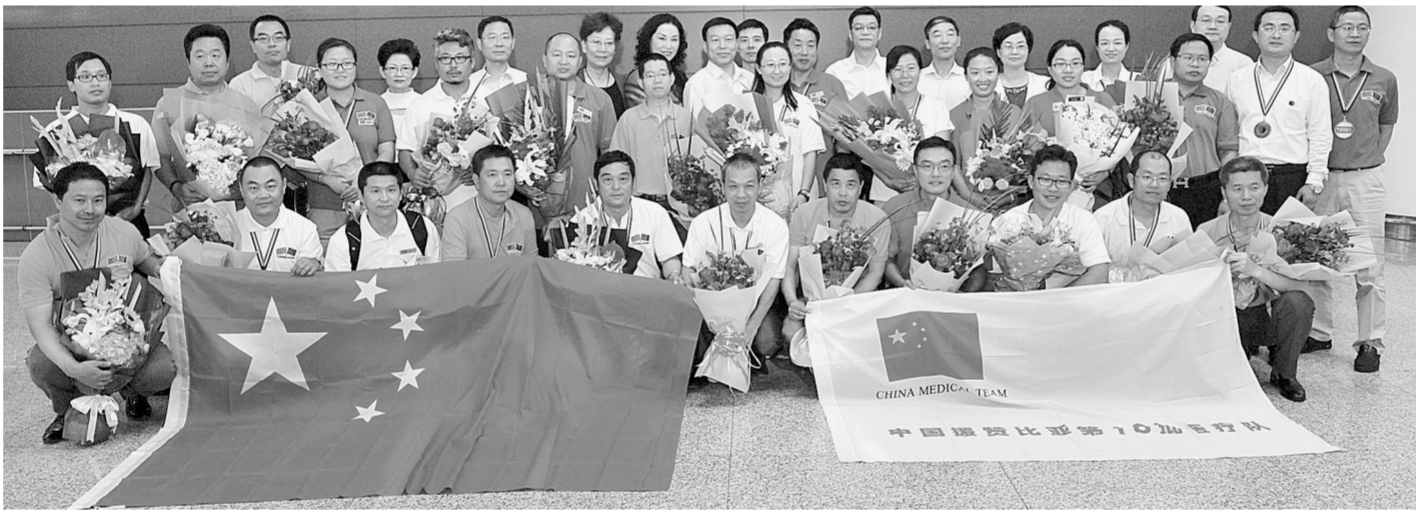
2017年5月31日,第18批援赞医疗队胜利回国