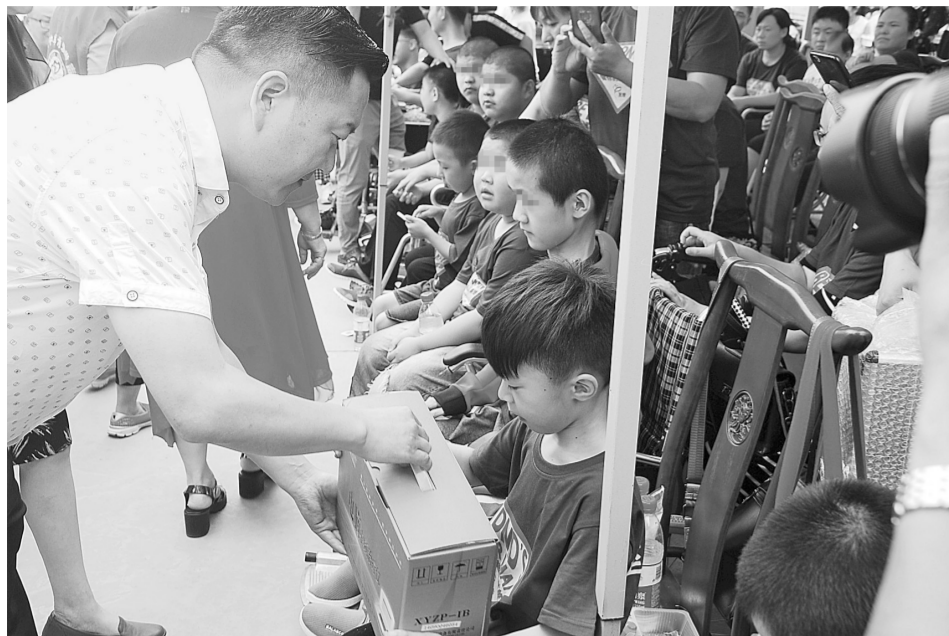
来自全省的55位“渐冻人”患者收到治疗仪、书本等爱心物品

6月17日上午,在位于中牟官渡镇的河南残友培训就业孵化基地,“一起解冻为爱破冰”关爱DMD儿童“王宽家”大型公益活动正式拉开帷幕。