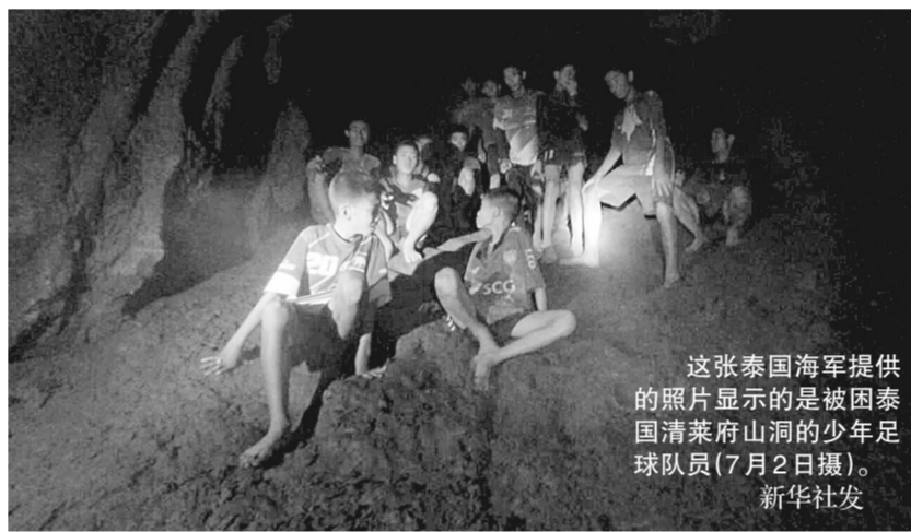
这张泰国海军提供的照片显示的是被困泰国清莱府山洞的少年足球队队员(7月2日摄)。新华社发

包括中国救援队在内的多支国际救援队驰援这场泰国近年来最大规模搜救，见证人类命运相连、休戚与共。