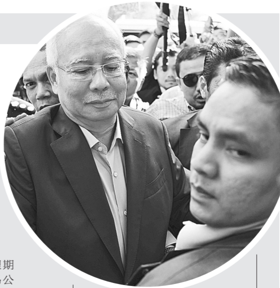
这是5月22日纳吉布(中)到达马来西亚普特拉贾亚的反腐败委员会大楼的资料照片。