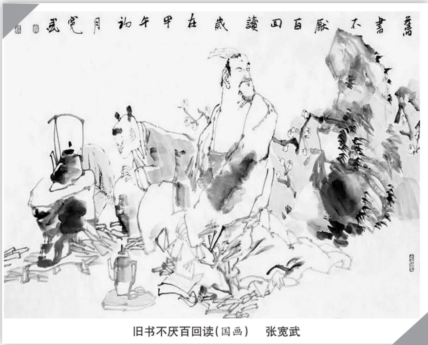
旧书不厌百回读(国画) 张宽武

麻雀很年轻，笑的时候会露出一排白牙。据说他的舞跳得特别好，还有一手剃头的手艺。那天麻雀像老朋友一样，为陈山剃了一次头。他离开开将堂的时候，他还留下了一袋中药给刘兰芝。