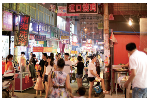
曾经的“中原小香港之夜”，人潮汹涌。

“千淘万漉虽辛苦，吹尽狂沙始见金。”回望四年城改路，美盛人深深懂得：是郑州市、金水区、丰庆路办事处各级政府对两村的改造高度重视、大力支持、指导有方、行动有力，是两村村委会、广大村民、流动人口的充分理解、通力配合，才保证两村动迁、搬迁、征迁、安置的顺利进行，各项工作稳步推进。饮水思源，当感恩时代，感恩政府，感恩百姓。作为企业，只有在各级政府的正确领导下，勇担企业重责，恪尽企业职守，时刻将政府放心、百姓满意、区域跨越式发展放在首位，将企业的社会责任、社会效益放在首位，秉承对城市、对区域、对社会、对民众、对土地高度负责的态度，敢于舍弃、牺牲企业的一己利益，建造综合品质高于同区域商品住房的安置区，完善各类文化、教育、商业、新型专业市场配套，腾挪建设用地让位于公共绿地和公共场所，美盛人有信心、有能力在两村的土地之上建设一座文化教育之城、生态宜居之城、美好生活之城、商业缤纷之城、配套繁盛之城。