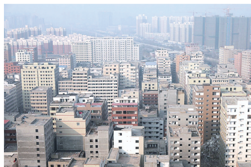
改造前的陈砦村建筑原貌，如今已成记忆。