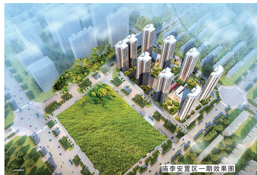
庙李安置区一期效果图

正是在金水区、丰庆路办事处等政府部门、多位领导的榜样力量感召下，美盛人才能人心齐泰山移，众志成城，众人划桨开大船，齐心协力创伟业。