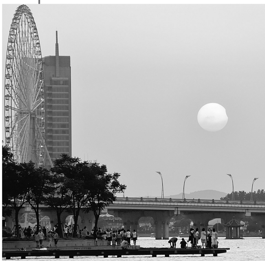
8月11日,人们在江苏无锡观赏日偏食天象。当日傍晚时分,天宇上演日偏食天象,这是今年我国能观测到的唯一一次日食。