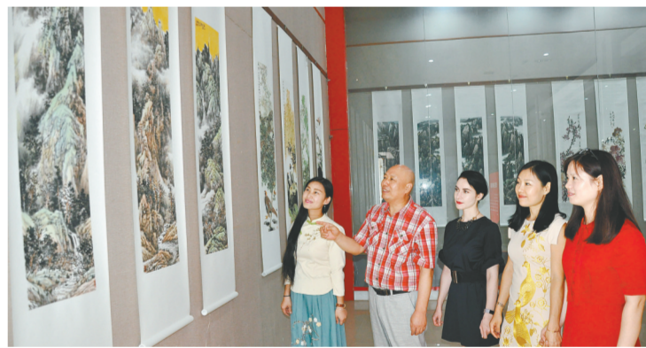
“金秋河南大观第三届四条屏联展”正在河南大观美术馆展出,我省近百位画家创作的近200幅花鸟、山水四条屏作品参展。展览将持续至9月15日,免费对公众开放。

影片由宣言、邢佳栋、丁洋联袂出演,通过一场正义与邪恶的博弈,展现了青年检察官的责任与担当,彰显了“法亦容情”的家国情怀,并引导大家对经济利益发展与生态环境保护展开深刻思索,呼吁观众关注生态文明建设,为子孙后代留下一片绿水青山。