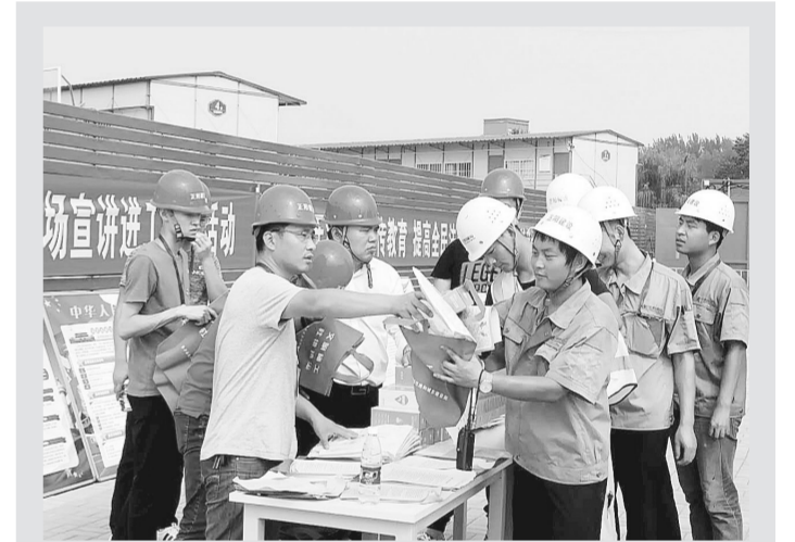
连日来,惠济区住建局依托建筑工地“红色驿站”政务服务直通车上门服务功能,分别在薛岗安置区、建业花园里七号院等8个建筑工地开展了“党的创新理论万场宣讲进工地”活动,以省委、市委、区委全会精神暨工作精神、依法治区、安全生产等为宣讲主题,帮助广大外来务工人员树立法治观念,增强法律意识,提高外来务工人员依法维权的能力。本报记者 梁月琳 摄

扫黑除恶专项斗争的通告》2万余份,印发致辖区居民的一封信5万份,悬挂宣传条幅150余条,搭设宣传版面20块。在辖区主要道路及施工工地制作扫黑除恶大型喷绘。创新利用街道、社区的微信公众号、微博、今日头条APP以及新闻客户端等多个新媒体平台,形成了覆盖面广、传播及时的扫黑除恶专项斗争新媒体矩阵。加大巡逻力量,筑牢扫黑除恶专项斗争“防护网”。