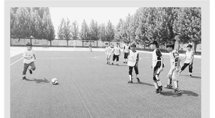
新学期开学了,中牟县狼城岗镇南韦滩村小学的孩子一进校园,就被眼前的场景惊呆了:绿莹莹的操场敞开怀抱拥抱返校的孩子们。

南韦滩村小学是河南省人口计生研究院精神文明结对帮扶学校。该研究院在多次对学校开展帮扶活动时了解到,该校水泥操场凹凸不平,一到下雨天,低洼处就积满雨水,操场上还横七竖八裂了许多大缝。因学校资金有限,一直没有修缮,学生们的体育活动因此减少了许多。该研究院在与校方商议后,决定由研究院出资,利用暑假,为学校改造操场。如今实现了“拥有一个平整的、不受天气影响的操场”的愿望,全校师生颇感欣慰。