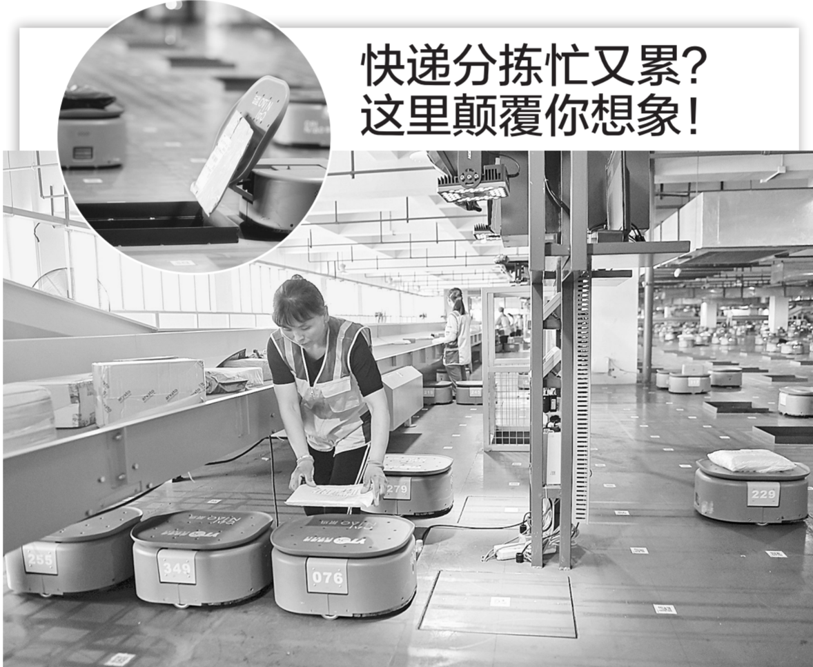
快递分拣忙又累? 这里颠覆你想象!

据了解,下一阶段,国家版权局将重点打击短视频领域侵权盗版行为,引导短视频平台企业规范版权授权和传播规则,强化行业自律,推动短视频行业健康发展,为广大网民提供风清气正的网络版权环境。