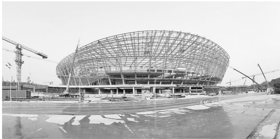
建设中的奥体中心

10月8日,2018年中国中小城市科学发展指数研究成果报告发布,全国综合实力百强县市、区,投资潜力百强县市、区等11大榜单出炉。中原区上榜“2018年度全国投资潜力前100强市辖区”“2018年度全国科技创新百强市辖区”“2018年度新型城镇化质量百强区”。