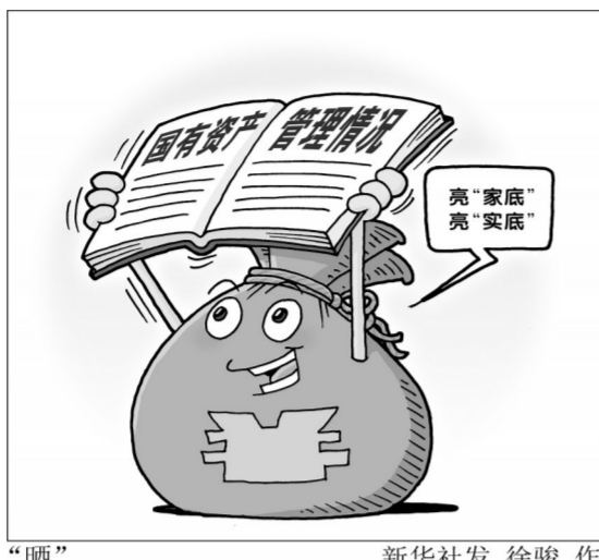
新华社发 徐骏 作

此次提请审议的综合报告口径、全覆盖地摸清了国有资产“家底”,报告了各类国有资产的基本情况、现