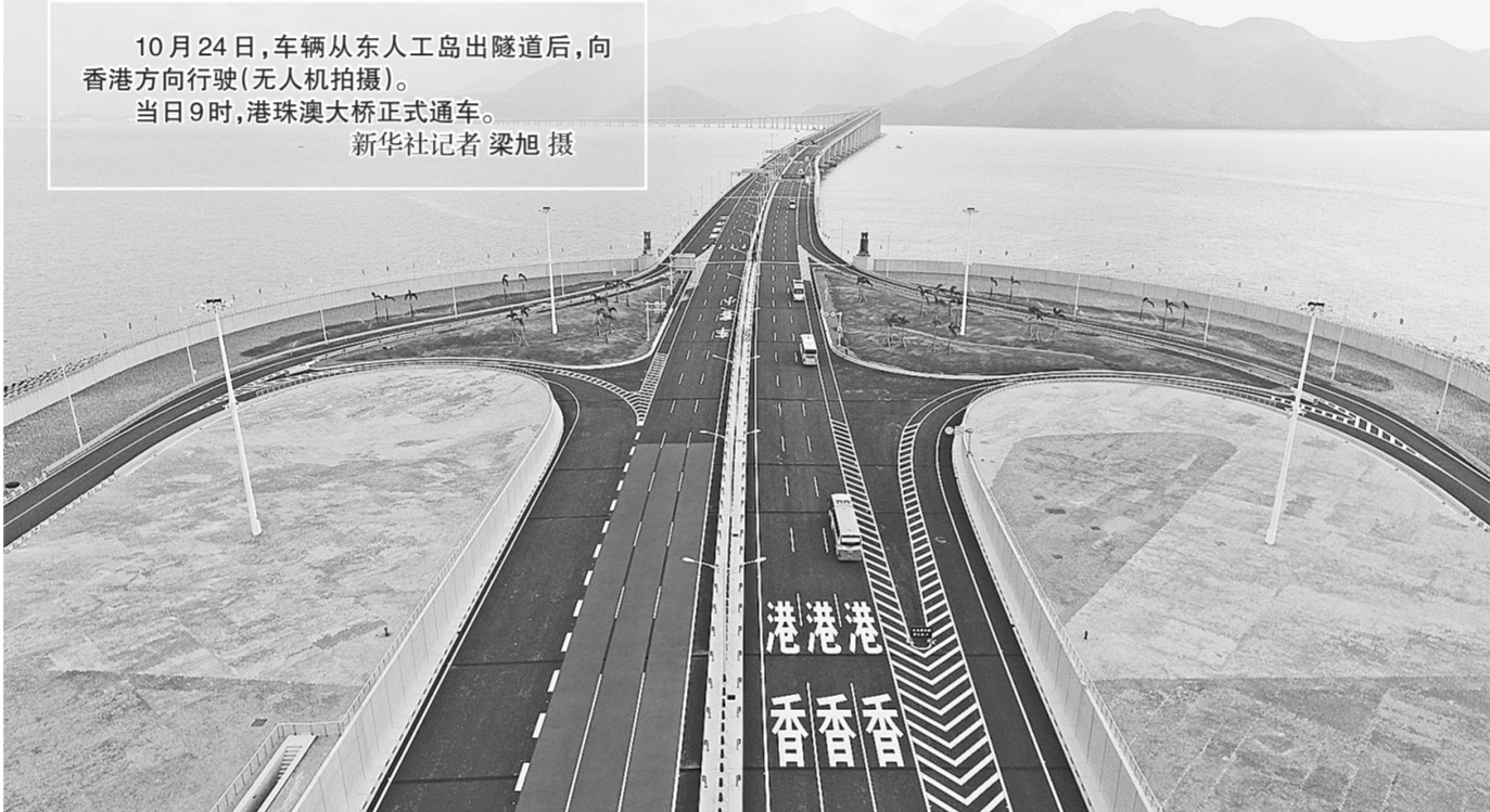
10月24日,车辆从东人工岛出隧道后,向香港方向行驶(无人机拍摄)。当日9时,港珠澳大桥正式通车。

当,乘客多是专程来体验港珠澳大桥的。“穿梭巴士5到10分钟一班,随到随走,单程票价65澳门元,很实惠。”澳门居民白女士说,巴士走在大桥上很平稳,沿途风光很不错,比坐船感觉要舒服。