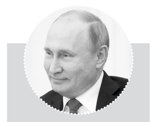
10月23日,在俄罗斯莫斯科克里姆林宫,俄总统普京出席与美国总统国家安全事务助理博尔顿的会议。

宣告告诉记者,他“可能”与普京会晤,双方正在讨论。普京告诉博尔顿,他希望与特朗普讨论一系列军控议题,包括美国打算退出《苏欧和美国消除两国中程和中短程导弹条约》,即《中导条约》。