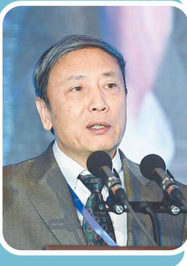
国家支持郑州建设国家中心城市,在中国社会科学院副院长、学部委员、中国社会科学院郑州市人民政府郑州

——访中国社会科学院副院长、学部委员、中国社会科学院郑州市人民政府郑州研究院院长蔡昉