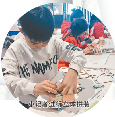
小记者在制作环保帆布袋