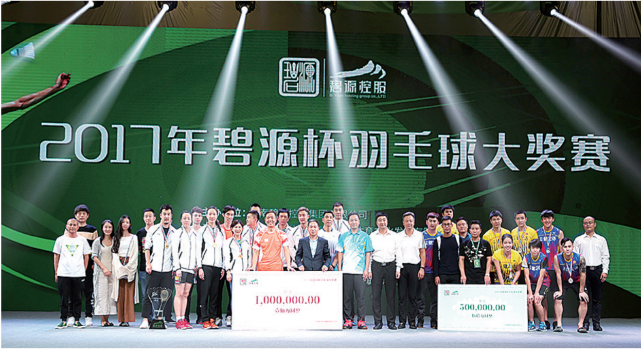
2017年碧源杯羽毛球大奖赛合影

体育是促进文化交流的重要窗口，国家“一带一路”倡议的提出和深入推进，也为羽毛球运动发展带来了全新的机遇。羽毛球运动因其广泛的传播面与独特的文化内涵，早在上世纪70年代初，“羽毛球外交”就已经载入史册，在推动国与国之间增加交流、建立友谊、传递思想的过程中发挥了重大作用。今天，羽毛球运动已经发