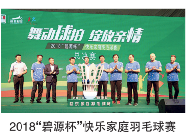
2018“碧源杯”快乐家庭羽毛球赛

这是一场体育与梦想的盛会，这是一次城市与城市的交流，这是碧源控股呈现给郑州的国际级羽毛球赛事。12月8日至9日，河南省体育馆，由亚洲羽毛球联合会、中国羽毛球协会、郑州市体育局主办，河南碧源控股集团有限公司承办的“碧源·亚洲羽毛球精英巡回赛”总决赛将在此开战。经过深圳、济南、成都三个分站赛的层层激战，最终胜出的10支俱乐部球队、1支亚羽联明星队和1支外卡球队齐聚郑州，争夺奖金高达200万元的冠军荣誉。