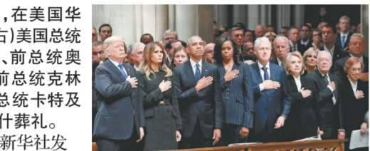
12月5日，在美国华盛顿，(从左至右)美国总统特朗普及夫人、前总统奥巴马及夫人、前总统克林顿及夫人、前总统卡特及夫人出席老布什葬礼。

路透社以多名美军官员为消息源报道，两架飞机可能在空中加油训练期间发生意外，撞机原因暂时不明。