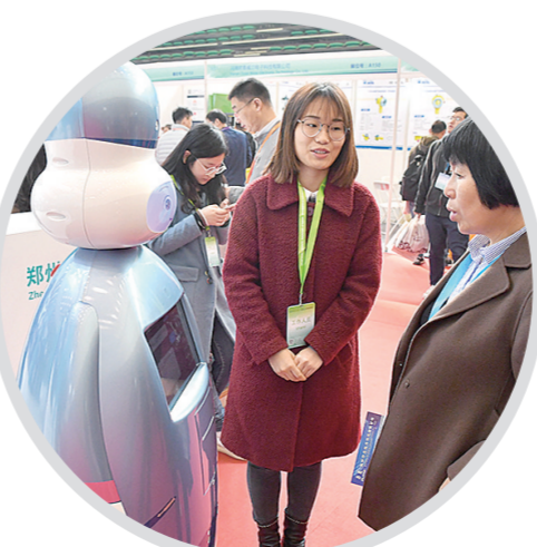
2018首届世界传感器大会,郑州高新区展厅前智能机器人和人交流。