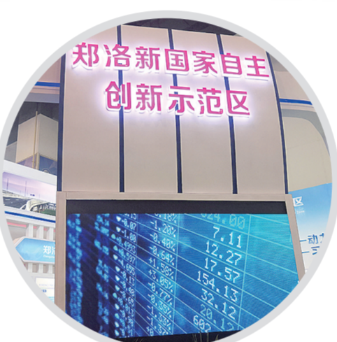
2018河南·郑州招才引智大会,郑洛新国家自主创新示范区特展展位。