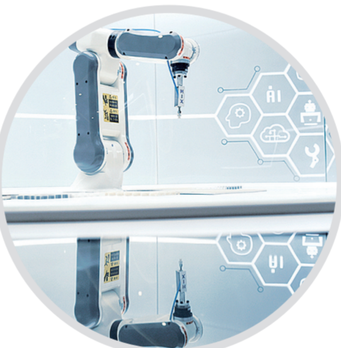
《科技的力量》。(拍摄于新华三大数据展厅)