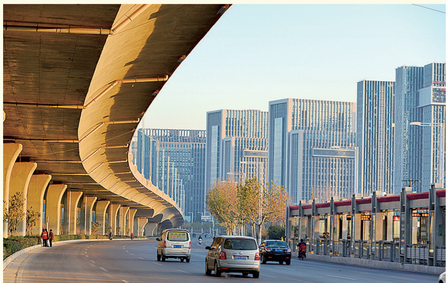
河南省国家大学科技园。