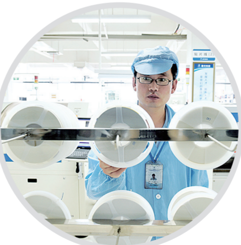
在新天科技SMT车间里,一位工程师认真检验用于制造智能表的元器件。