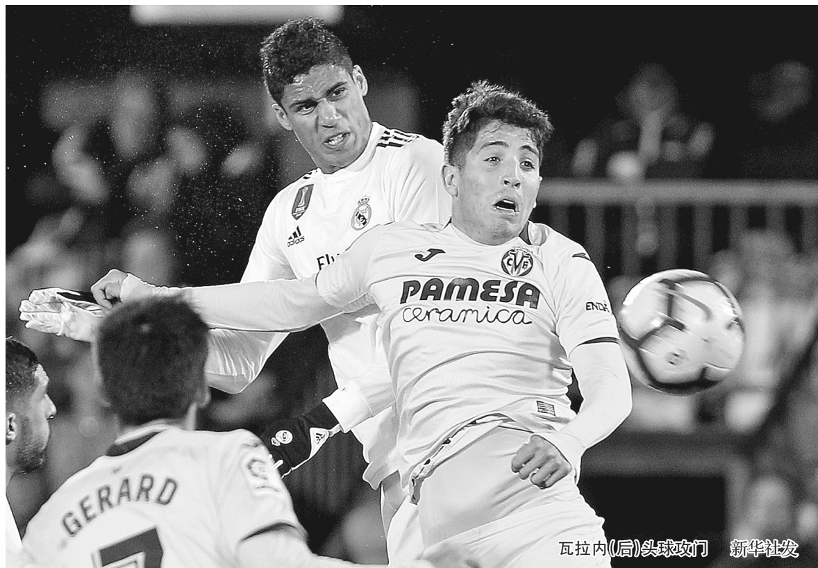
瓦拉内(后)头球攻门

新华社马德里1月3日电 西班牙足球甲级联赛3日进行第17轮的一场补赛,皇家马德里客场2:2被比利亚雷亚尔逼平,在积分榜上与榜首的巴萨已有7分差距。