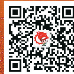
郑报悦学会小记者 官方微信公众账号

首先要选择合法的销售网点购买烟花爆竹,不图小便宜,购买非法生产的劣质爆竹。孩子在燃放爆竹时应由大人带领,在远离火源的空旷地带燃放,鞭炮燃放应放在地上,不要拿在手里。如果爆竹点燃之后没有反应,千万不要马上去查看,也不要随便去捡一时没响的爆竹。