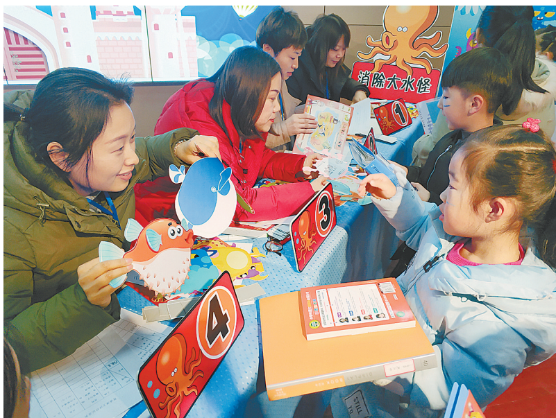
二七区人和路小学学生“拯救”美人鱼

一张张精彩的国画彰显了孩子们的创意思维;精心写出一副副春联送给现场老师和学生;科学社团带你体验神奇的二氧化碳……管城回族区港湾路小学丰富多彩的社团成果展示活动,成为学子们自我成长、自我锻炼的舞台,更是他们展现自我的自由平台。学校根据学生年龄特点、兴趣爱好,挖掘自身优势,开设舞蹈、诵读、书法等社团活动课程,挖掘学生潜能,让学生充分发挥特长。学生徜徉于社团活动中,不仅学到了知识,能量也得到了充分的释放,获得了美的享受。