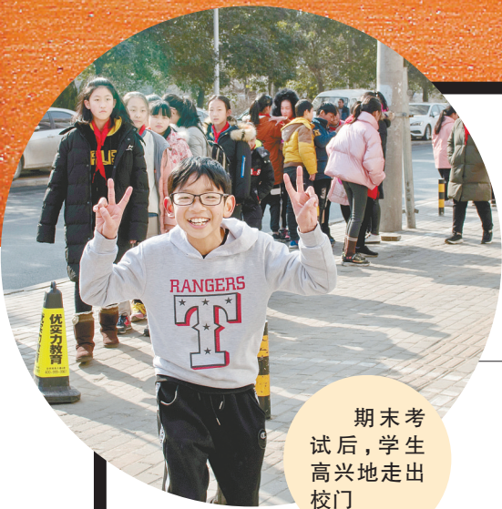
期末考试后,学生高兴地走出校门

寒假即将来临,对于不少孩子和家长来说,都是一件轻松愉快的事情。但其实,想要拥有一个充实而有意义的假期并不容易。应该如何对假期进行合理规划和安排?怎样才能度过一个有益有趣的快乐假期?记者采访了市部分教育专家和经验丰富的老师,请他们为各位学生和家