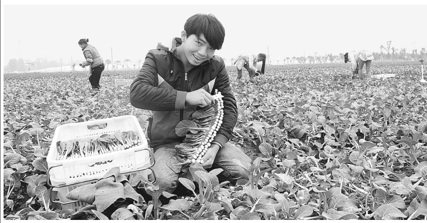
合作社农户采摘蔬菜