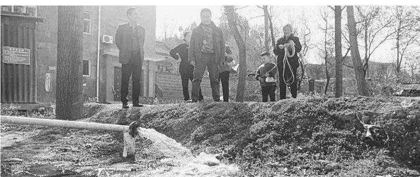
寺沟村机井成功出水

勘；走遍了寺沟村角角落落，访遍了寺沟村每一位老人，2018年10月23日，终于确定机井方位，施工队打下第一钻。150天后，钻头下探至650米，甘甜的井水喷涌而出。经初步测算，该井每小时出水30吨左右，完全可以