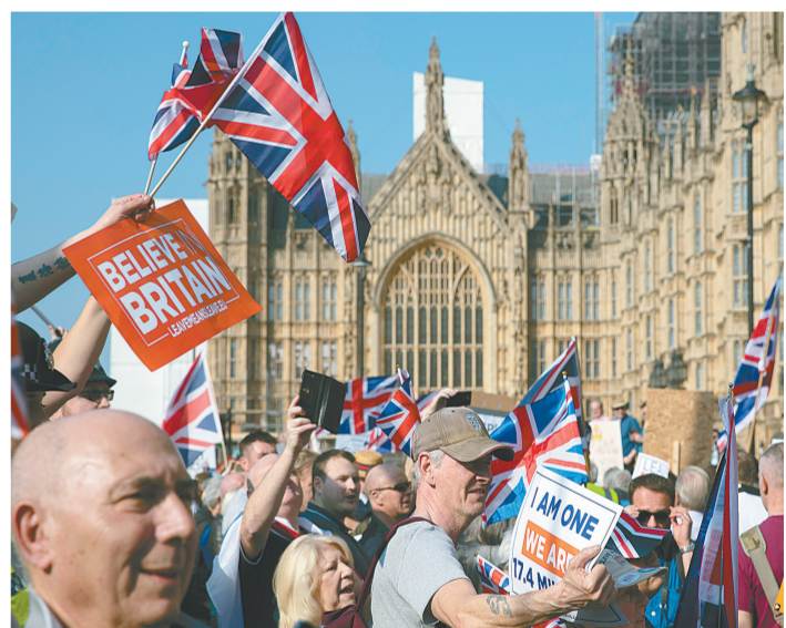
3月29日,在英国伦敦,支持“脱欧”的民众在议会大厦外集会。英国议会下院29日投票否决了“脱欧”协议关键部分,这进一步增加了英国“脱欧”的不确定性。当日,议会下院经过辩论,最终以344票反对、286票支持的结果否决了一份呼吁“通过退出协议”的动议。退出协议被认为是英国政府与欧盟此前达成的“脱欧”协议的重要组成部分。

英国多名亲欧洲联盟的中间派议员不满各自所属政党就“脱欧”所持立场,退党后组成新团体,29日递交申请,要求组建名为“改变英国”的新政党。