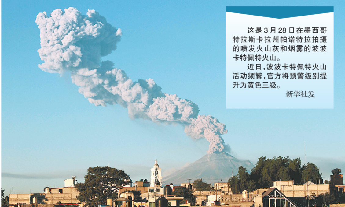
这是3月28日在墨西哥特拉斯卡拉州帕诺特拉拍摄的喷发火山灰和烟雾的波波卡特佩特火山。近日,波波卡特佩特火山活动频繁,官方将预警级别提升为黄色三级。