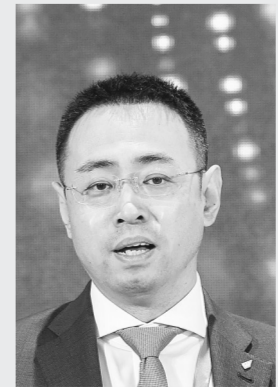
本报记者 成燕 文

息技术产业可谓非常熟悉。作为中德智能制造联盟成员,近年来,他致力于推动工业4.0在中国企业的落地以及智能制造和物联网、工业云平台的应用推广。“郑州工业基础雄厚,通过云计算、大数据等信息技术可以为产业实现赋能,科学布局全新的产业生态链,进而形成新型产业链集群。在汽车制造、机械装备制造等多个产业,都可以打造更多的产业赋能中心,推动传统工业走向智能化、信息化。”结束采访时,董志刚充满信心地说。