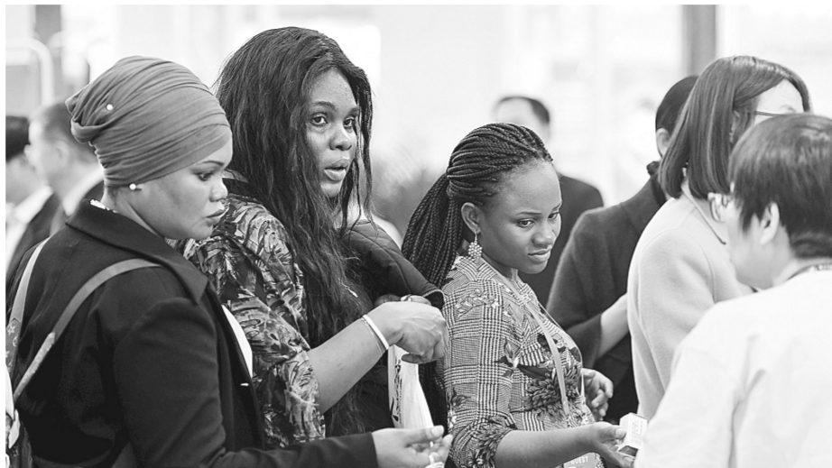
中国产品吸引了非洲朋友

本届投洽会共设两层展馆,10个展示厅,设置出口商品展区、进口商品展区、国际合作展区、服务业展区、智能制造与服务展区等5大展区,吸引境内外参展企业412家。本次展览展示首次设置省辖市展区。各市通过多媒体演示、文化演出、摆放实物展品和招商资料等多种形式,展示各地产业优势、文旅资源等。位于该展区核心位置的郑州市情展区,吸引众多嘉宾关注的目光。据市会展办相关负责人介绍,郑州展区总面积达504平方米,展区色彩以蓝、白为主色调,设计风格简洁大气。展厅正面以展开双臂的造型设计,寓意郑州正以开放的姿态欢迎四海宾朋。两侧丝带环绕,象征郑州正深度融入共建“一带一路”,着力打造内陆地区开放高地。该展区利用37块彩色推介版面,从不同侧面全面展示郑州的发展优势。近年来,郑州加快推进国家中心城市高质量建设,持续扩大空中丝绸之路、陆上丝绸之路、网上