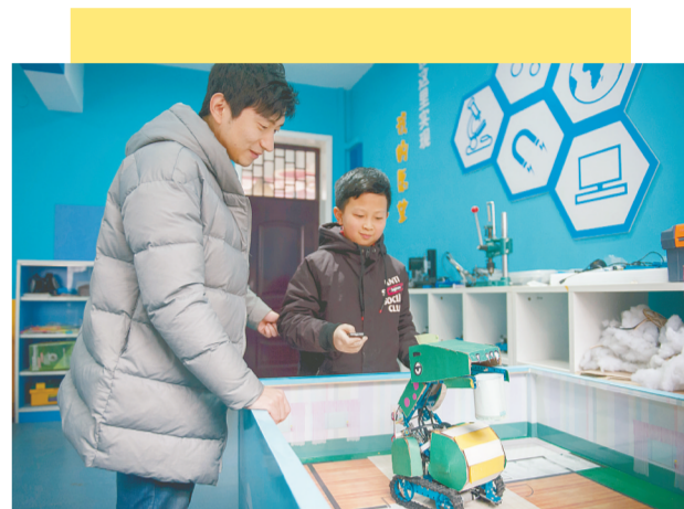
学生调试智能倒垃圾机器人