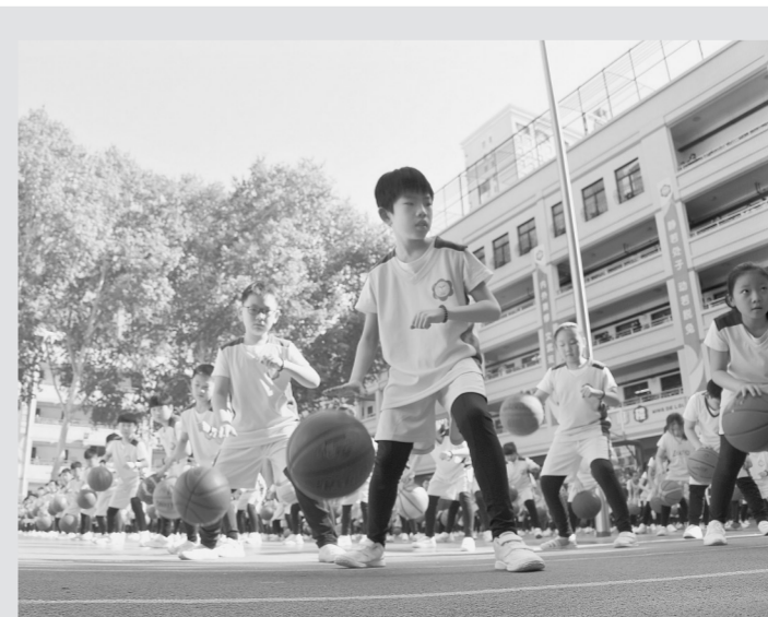
近年来,“郑州市中小学校阳光体育大课间”活动在我市各中小学开展得如火如荼,大大改善了我市中小学生的身体素质,各个学校都根据自己的特点安排了不同特色的阳光体育大课间活动。图为纬一路小学开展的“酷雅篮球”大课间活动。

本项赛事旨在为我市习练网球的小选手搭建一个切磋交流一展风采的平台,通过比赛进一步检验他们的学习效果,激发他们学习网球的兴趣。短式网球作为网球项目的人门运动,可以很好地培养小选手对于网球的兴趣以及球感。今年赛事将网球和短式网球两个项目同时举办,也是为了通过不同项目的比赛,进一步促进网球运动在郑州市的普及和发展。