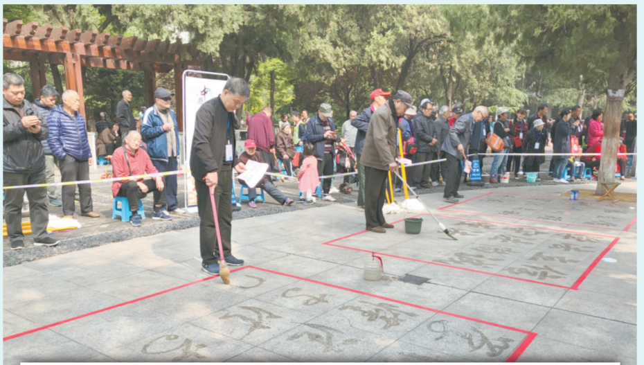
昨日,“中国梦·大地情”郑州园林广场群众书法大赛在五一公园举行,数百名地书高手以共秀地书的形式庆祝佳节。

石窟寺,五一当天出生、巩义本地及60岁以上游客凭身份证也可免费参观该景区。假日期间,郑州园博园将举办汉服婚礼展示、汉风集市、汉服游园、舞蹈演出、近景魔术、网红民谣歌手演唱、乐器演奏、才艺秀、戏曲演唱活动。黄帝故里将推出专场拜祖活动,游客可近距离体验。巩义欧阳修公园将推出欧阳修廉洁小故事展览、拓片免费体验活动。五一当天生日游客、外县市欧氏后裔和县级以上五一奖章获得者、劳模等5月1日可免费领取祈福牌一枚。5月1日~4日11:00~17:00,古柏渡炎黄旅游区将推出沙滩排球赛、主题亲子活动、沙雕比赛。凡市级以上劳动奖章、劳动模范获得者及5月1日当天生日的游客,可凭有效证件免该景区门票。郑州绿博园将举办“逐梦新时代 绿博百花宴”花展活动,蔷薇、月季、芍药、玫瑰、鸢尾等百花争艳。5月1日~12日,郑州黄河富景生态世界将推出2019郑州百万紫荆花海旅游文化节。五一期间,方特欢乐世界将推出活力舞蹈、酷炫表演、熊熊小巡游、熊熊运动会。方特梦幻王国将举办缤纷演艺、梦幻星河大巡游、篝火狂欢主题演出。