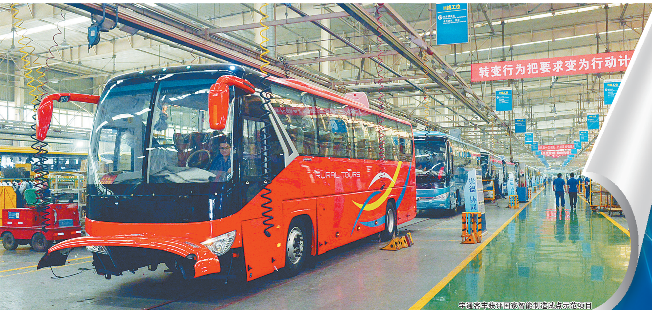
宇通客车获评国家智能制造试点示范项目