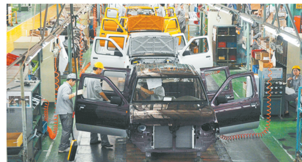
郑州日产成为18类省级各类试点示范