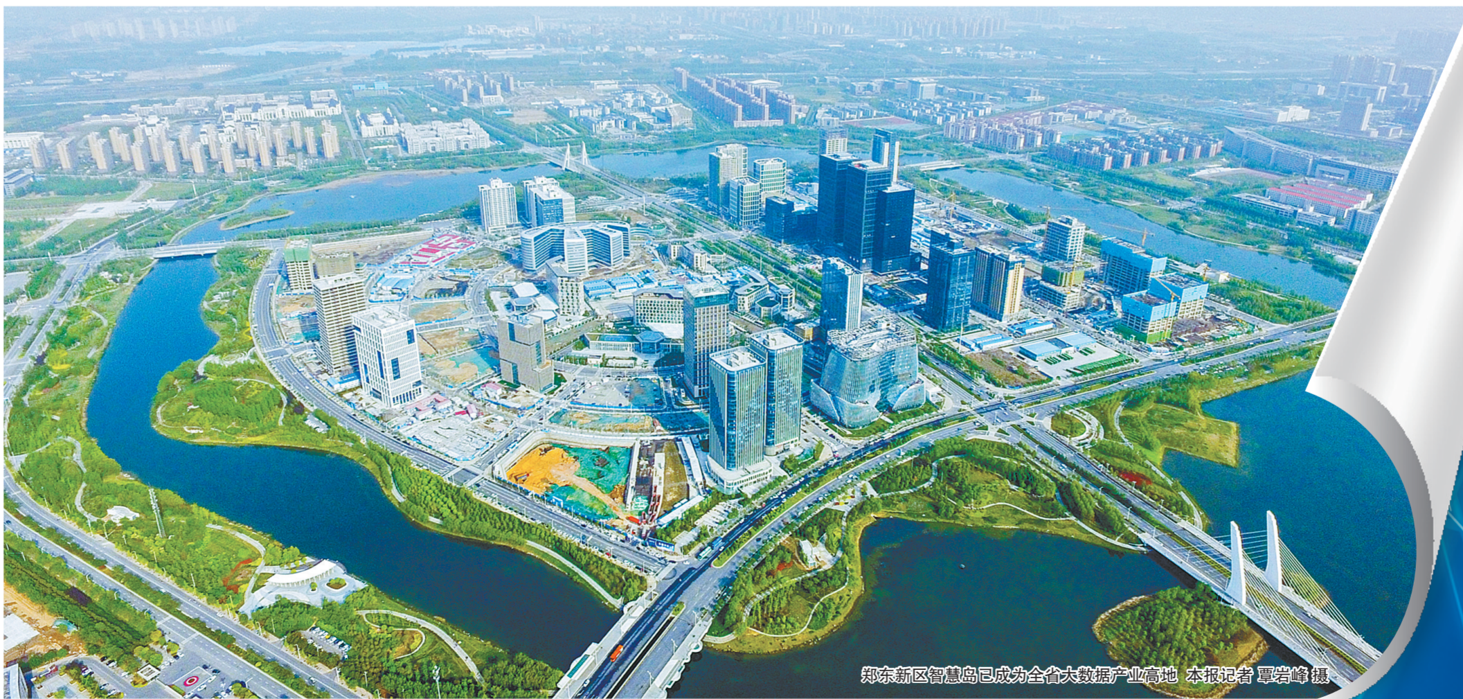
郑东新区智慧岛已成为全省大数据产业高地