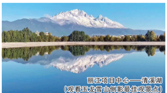
丽江项目中心——清溪湖（观看玉龙雪山倒影最佳 viewpoint）

2012~2017年，丽江旅游业发展势头良好，旅游人数不断增长，6年年均复合增长率达20.54%。