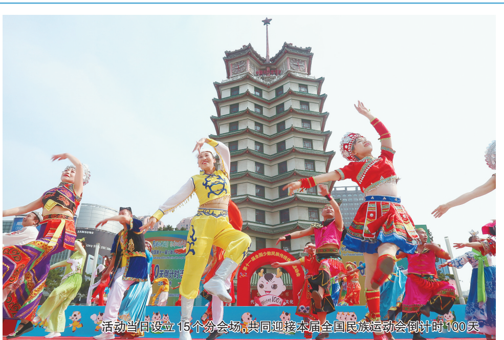
活动当日设立15个分会场,共同迎接本届全国少数民族传统体育运动会倒计时100天