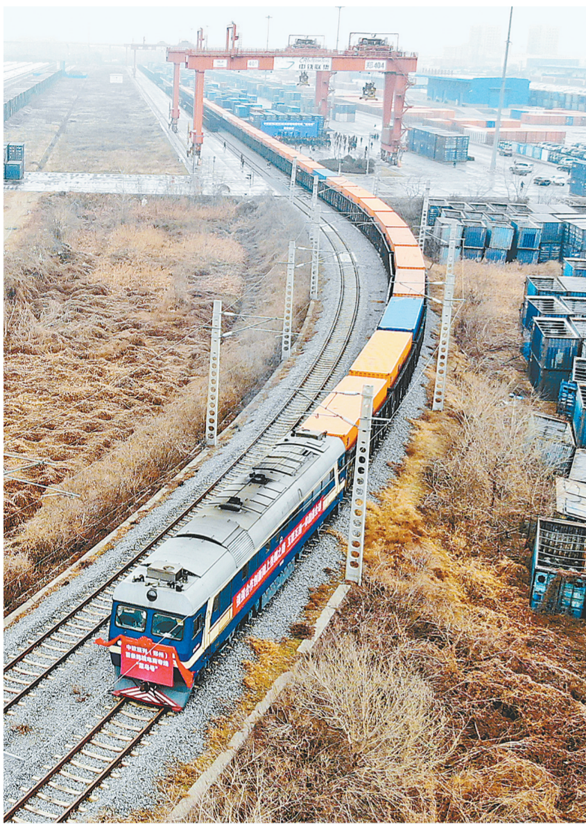
3月2日,随着“菜鸟号”从中铁联集郑州中心站驶出,中欧班列(郑州)首条跨境电商专列正式开通,这条专列将由郑州驶向比利时列日。

昨日,经济日报刊发通讯,以“郑州推进跨境电商产业阳光化便利化——跨境电商撬动外贸转型发展”为题,报道郑州充分发挥区位优势,着力构筑成本优势,强化东西合作互补,厚植健康发展沃土,跨境电子商务已成为外贸增长新亮点、转型升级新动能的成功经验和做法。本报今日予以转载,敬请关注。