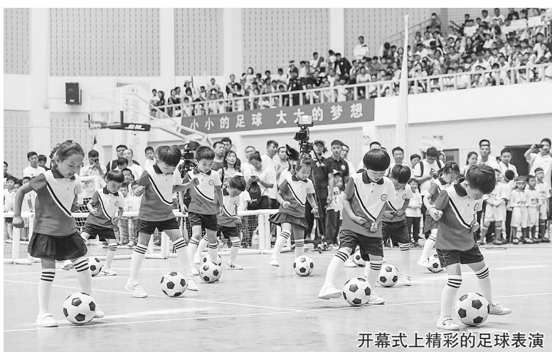
开幕式上精彩的足球表演

足球保险、真人桌上足球、运球大赛、蹦床足球……操场上的家庭赛现场,一片欢声笑语。在足球DIY活动项目里,孩子们在白色足球上进行自主创作,天马行空的创意,独具匠心的绘画,一个个小艺术家在圆形的足球上认真创作,既是足球也是艺术品,更是孩子童年美好的回忆,同时也进一步培养孩子