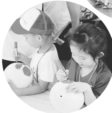
孩子们在足球上进行DIY创作