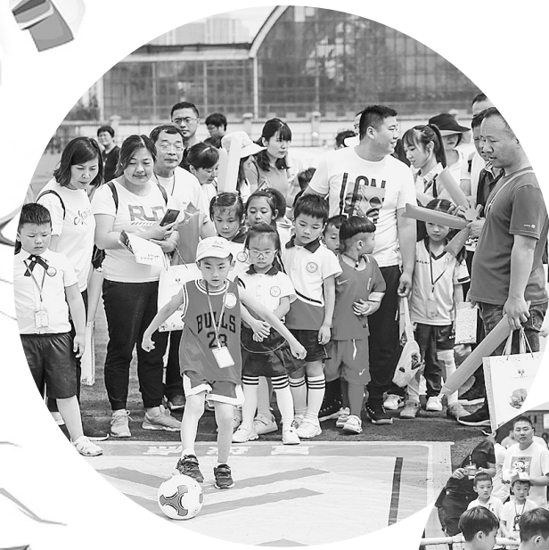
操场上的家庭赛吸引不少孩子和家长参与

记者了解到,我市已连续3年成功举办“庆六一”幼儿足球嘉年华活动,此项活动的举办,不仅锻炼了幼儿的身体,增强了幼儿的体质,更进一步增强了幼儿喜爱足球的情感及热爱运动的精神,同时也加深了父母和子女之间的情感沟通,激发了幼儿合作与竞争的意识,培养了幼儿勇于挑战、克服困难的良好意志品质,使孩子们在活动中成长、受益,养成终生运动的习惯,为建设和谐社会、和谐校园、和谐家庭奠定了基础。