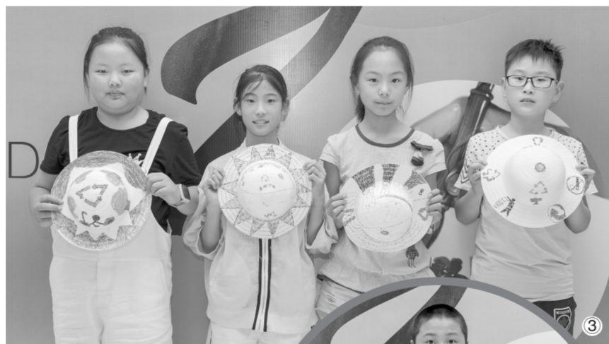
图①②③④为学生作品展示