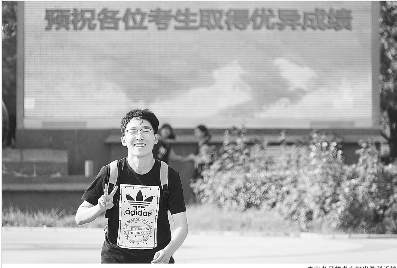
走出考场的考生打出胜利手势

2019年全国普通高考昨日落下帷幕,高考试题依然是大家关注的热点。今年的全国高考试题透露着哪些变化,蕴藏着哪些趋势?本报全媒体记者邀请郑州外国语学校的高三备课组长“组团”,进行了一番评析。