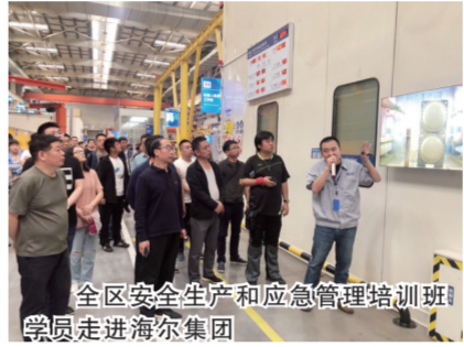
全区安全生产和应急管理培训班学员走进海尔集团