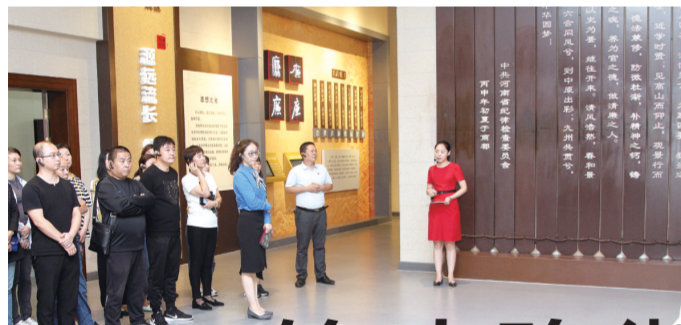
接受廉政教育强党性

在铭功路与二道街西北角，造型别致的微景观、舒适的座椅吸引着过往群众驻足观赏、休息。走进铭功路街道辖区，不停地被辖区悄然发生变化的面貌惊艳——