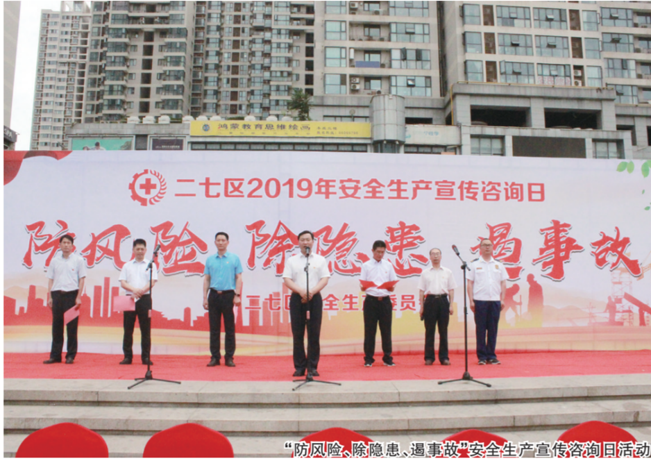
“防风险、除隐患、遏事故”安全生产宣传咨询日活动

线上和线下的有机结合，有效解决了“认不清、想不到”的问题，形成了企业风险管控和隐患排查治理的“防火墙”，实时把控风险治理隐患，省安委办多次组织观摩学习，为全省双重预防机制建设提供了可复制的“二七方案”。“互联网+安全监管”新模式得到省领导批示并在全省推广。