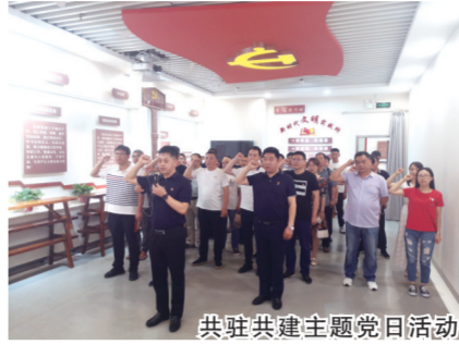
共驻共建主题党日活动

把党员发挥作用作为队伍建设落脚点，大力开展“服务型”执法活动，作企业的“娘家人”、“贴心人”。在深入了解从业人员数量少、企业负责人文化素质低、安全基础设施薄弱的小微企业生产经营情况和当前面临的实际问题及困难的基础上，“手把手”指导企业开展安全隐患排查整治工作，帮助企业建立健全各项安全生产制度，推行安全生产标准化建设和清单化管理，督促企业落实安全生产主体责任，变事后处罚为事前防范。