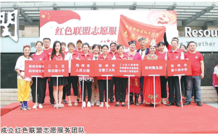
成立红色联盟志愿服务团队

30天内完成准备工作，90天内完成整治……在铁路沿线整治工作中，创造了“铭功路速度”，打了一场漂亮的胜仗。在此过程中，街道坚持组织领导到位、责任落实到位、政