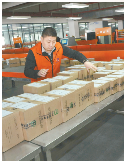
河南跨境电子商务e贸易综合服务中心

同步推出的还有一个整版的“聚集河南自贸试验区”解读，更详尽地介绍了这一国家战略带给郑州开放发展的重要意义。