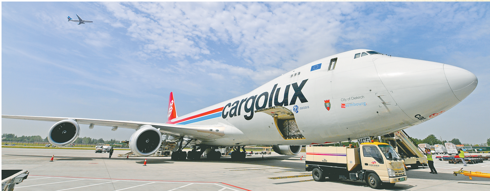
郑州航空港区卢森堡国际货运航班

八个版的特刊中，对和郑州一起被列入国家中心城市建设的城市进行解读，回顾了郑州进入国家中心城市队列所经历的历程，郑州进入国家中心城市的实力底气，涉及综合实力、交通优势、对外开放、城市建设、文化底蕴等各个方面。