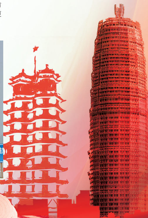
临空经济有序发展