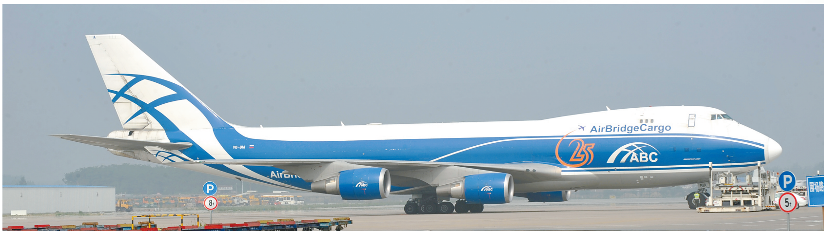
本报记者 刘超峰 文