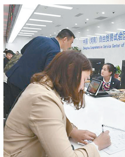
中国(河南)自贸区办事大厅

消息分析了这一喜讯带给郑州跨境电商的发展利好，并采访多个专业人士，分析未来我市跨境产业如何抢抓机遇实现更好发展。