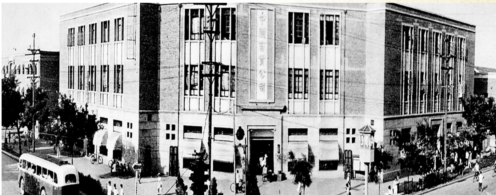
20世纪50年代郑州百货公司