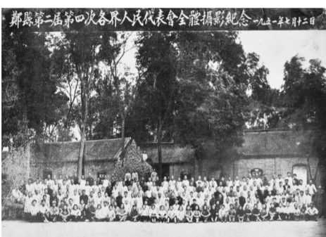
郑县第二届第四次各界人民代表全体合影