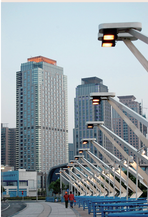
绿地峰会天下：郑东新区CBD外环标志性写字楼之一。

城市运营的核心本质是提升城市价值。新型城市化和产城融合，需要对城市各类资源进行优化整合和市场化分配，最终实现资源合理利用和高效利用，实现生产、生活、生态的平衡。绿地集团“大基建、大金融、大消费以及科创、康养等新兴产业并举发展”的“3+X”多元经营格局正逐步落位中原，为郑州日新月异的发展添砖加瓦，为中原经济崛起添薪加柴，引领中原百姓开启更精彩的多元生活。