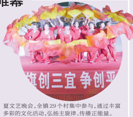
夏文艺晚会,全镇29个村集中参与,通过丰富多彩的文化活动,弘扬主旋律、传播正能量。

7月3日晚上,巩义市涉村镇为了丰富全镇群众精神文化生活,引导文明乡风,在镇政府文化广场举办的“摘星夺旗创三宜”——庆祝建党98周年暨新中国成立70周年消暑文艺晚会。晚会吸引了全镇各村2000余名基层群众观看,太极拳、戏曲对唱、旗袍秀等18个节目轮番登场,演员们通过歌舞感恩祖国感恩党,节目精彩纷呈,演员表演投入,观众热情高涨。据了解,在今后的两个月里,涉村镇将每周组织一场消