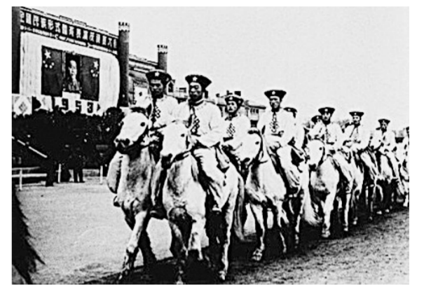
入场式上，蒙古族运动员以马队形式亮相

新中国刚刚诞生，党中央就对各民族民间传统体育活动十分重视。1953年11月8日至12日，在天津市举行了全国民族形式体育表演及竞赛大会。30年后，即1984年，国家体委、国家民委将这次体育运动会定为第一届全国少数民族传统体育运动会。从此，这项以少数民族传统体育为主的赛事活动便每4年一次地开展起来。