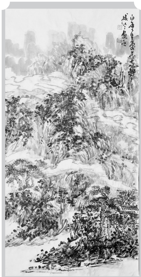
白云生处有人家(国画) 刘灿章

这一历史业绩相传了两千多年，感动了无数人。1965年11月，经周恩来总理亲自提名，国务院批准，把除旗店升改为社旗县，寓意为社会主义的一面旗帜，可见社旗在人们心中的位置。此县称沿袭至今，那个古老的除旗故事一直在民间流传。