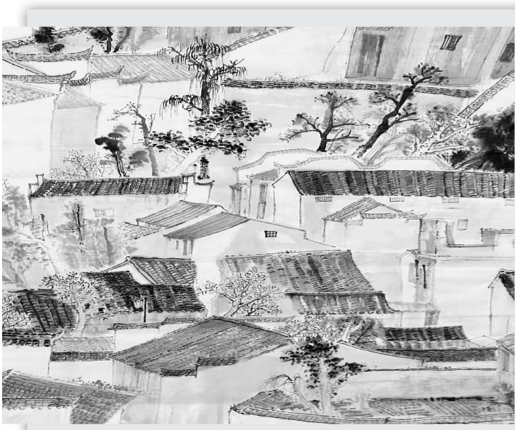
烟雨清幽梦故乡(国画) 赵进选

王国钦赋作的第三个特点，是不拘程式，注重创新。王国钦尝言：一种“文体通行既久，习套渐多。虽豪杰之士，亦难于其中自树立耳”。众所周知，