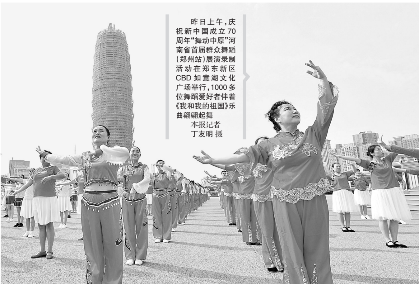
昨日上午,庆祝新中国成立70周年“舞动中原”河南省首届群众舞蹈(郑州站)展演录制活动在郑东新区CBD如意湖文化广场举行,1000多位舞蹈爱好者伴着《我和我的祖国》乐曲翩翩起舞。

未来两年,这6名河南籍新生将在清华大学学习公共基础课程、航天工程力学和航天航空工程专业课程,并进行跳伞、射击、野外生存拉练等军事课目训练。两年后,他们将回到空军航空大学和海军航空大学,继续进行航空理论学习和飞行训练。毕业后,他们将拿到加盖清华大学与空军、海军航空大学两枚印章的毕业证书,在成为合格飞行员的道路上迈开坚定步伐。