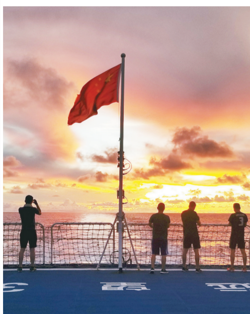
远望3号船船员在深蓝海洋中追梦