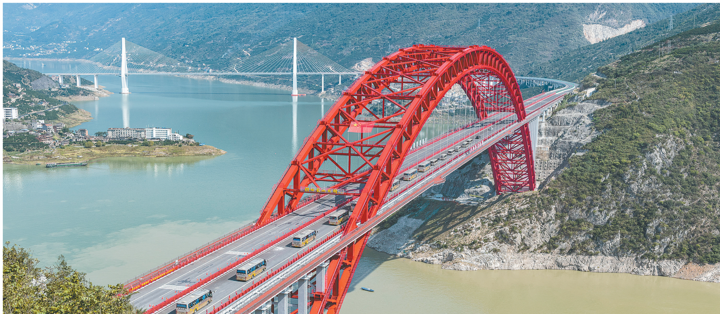
湖北秭归长江大桥建成通车