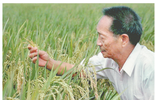
袁隆平在观察两系法杂交晚稻的生长情况