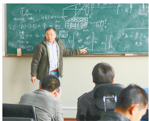
黄大年在为吉林大学的同学们授课