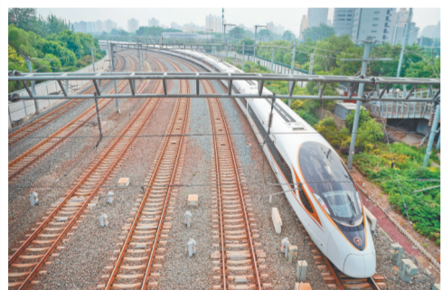
长编组“复兴号”动车组