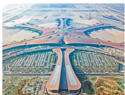
北京大兴国际机场航站楼